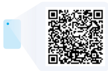
Налог на профессиональный доход (НПД, налог для «самозанятых»)